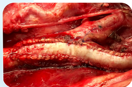
Parche vascular biológico XenoSure en endarterectomía carotídea